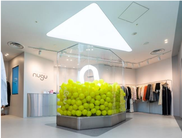
ルミネエスト新宿店（2023年8月）

ビーツは2023年8月に、日本のZ世代に絶大なる支持を受けるインフルエンサー基盤のファッションとライフスタイルのECプラットフォーム「nugu」を運営する Mediquitous Co. Ltd.（代表：イ・ドゥジン、韓国ソウル市、以下「メディコトス社」）と「nugu」事業をメインとした各種事業、並びに日本への進出を検討しているその他韓国企業に対する市場進出支援などに関する戦略的な業務提携を行い、「nugu」日本1号店となる「ルミネエスト新宿店」、2号店として2024年3月にルクア大阪に開店した「ルクア店」の施工を担当しました。「ルクア店」は開店から長蛇の列ができ、3日間で約1万人が来店するなどZ世代を中心に大きな注目を集めています。