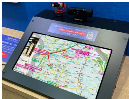
画面共有しペンツールで書き込み

リモート接客時はモニターに地図や写真、資料等を表示しお客様に画面を共有してご案内することができます。またペンツールで画面に自由に書き込むこともできるため、目的地へのご案内等もスムーズに行うことができます。