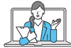
ローコストで導入OK!

数ある無人店舗サービスのなかでもビーツの「無人店舗 DX パッケージ」をおすすめするのは、ビーツには 40 年以上の店頭販促の実績とノウハウがあり、店頭ディスプレイの効果測定からの課題の洗い出しはもちろん、店頭什器・店舗内装、無人レジの設置から動画制作、接客オペレーター対応までを一括でサポートできるところです。