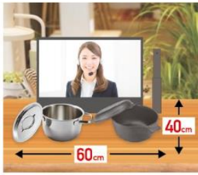
小スペースで導入OK