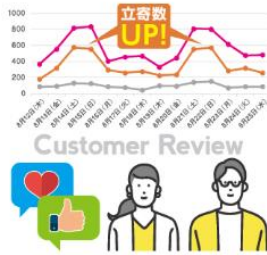
行動データや顧客の声も入手OK!