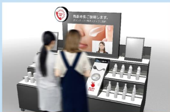
お客様がワンタッチで呼び出し、もしくは テレショッパーから声がけ