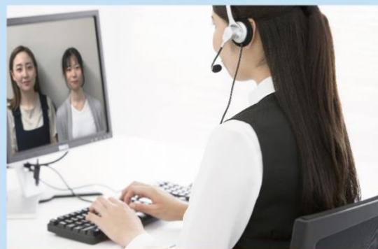
オンライン接客に特化したテレショッパー が対応する